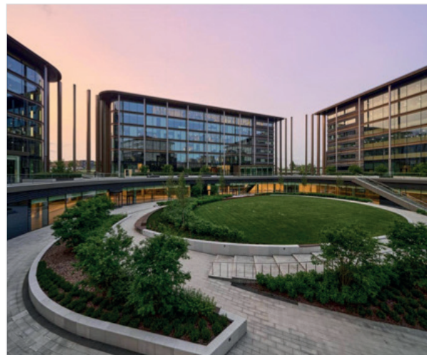
Рис. 4–5. «Сколково Парк» (Московская область)

В постсоветских странах, как правило, отсутствуют чёткие стратегии городского развития, направленные на систематическую ревитализацию и реконструкцию крупных жилых массивов. Единственная существующая на данный момент стратегия в России предлагает радикальное решение проблемы путём сноса этих зданий [8]. Программа реновации жилья в Москве — это программа правительства Москвы, направленная на улучшение жилищных условий жителей, снос малоэтажного жилого фонда, построенного в 1957–1968 годах. Программа рассчитана на 15 лет; по результатам голосования москвичей в неё войдёт более 5 000 домов [9]. Однако уверенность в успехе этой программы стоит под сомнением. Советские архитекторы проектировали пространственную систему и иерархию: раскладывали здания и сервисы по территории и рассчитывали, сколько времени нужно человеку, чтобы дойти до школы,