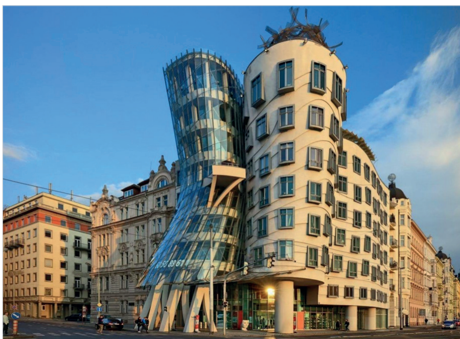
Рис. 3. Пример смешанной застройки. Прага, Чехия, набережная Рашина (Rašínovo nábřeží) и пересечение с улицей Resselova)

Здания должны различаться по возрасту, этажности и назначению. Возраст здания влияет на тип коммерции, которая в нём размещается: затраты на новое строительство будут покрываться за счёт аренды, а высокую аренду могут позволить себе лишь крупные корпорации с сетевыми магазинами или ресторанами; маленькая антикварная лавка или небольшая кофейня выберут здание постарше, где аренда дешевле. То же касается квартир или офисов. Всё это вместе создаёт разнообразие, живую и динамичную атмосферу, где каждый район или улица имеют свой неповторимый характер.